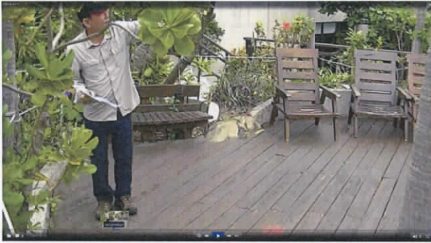
龍泉水段 799-1 地號