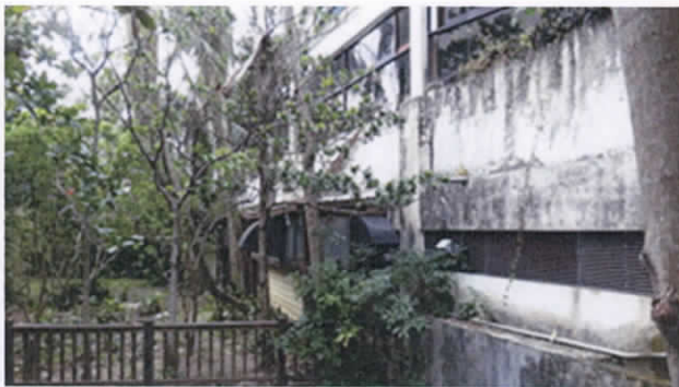
龍泉水段 803 地號

4. 第四勘查點：勘查申請解除區域西側之龍泉水段 803 地號土地建物之現況，另瞭解相鄰 802 地號土地林木生長現況，並說明 802 地號非屬申請解除區域。