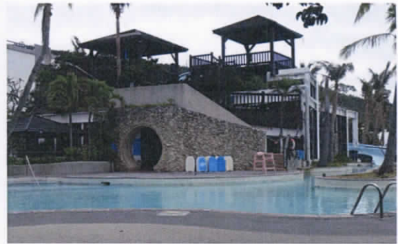
龍泉水段 803 地號

4. 第四勘查點：勘查申請解除區域西側之龍泉水段 803 地號土地建物之現況，另瞭解相鄰 802 地號土地林木生長現況，並說明 802 地號非屬申請解除區域。