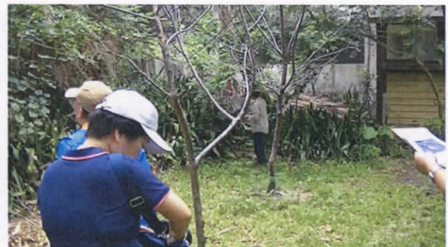
龍泉水段 802 地號