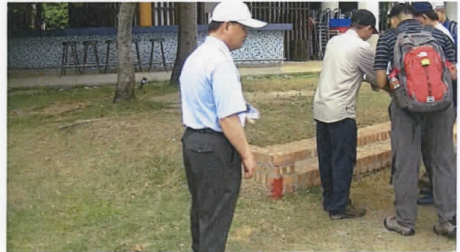
龍泉水段 800-1 地號

3. 第三勘查點：勘查申請解除區域中間之龍泉水段 799-1 及 803 地號土地之現況，799-1 地號為水池、草生地及少許林木，803 地號主要為水池、建物及走道。