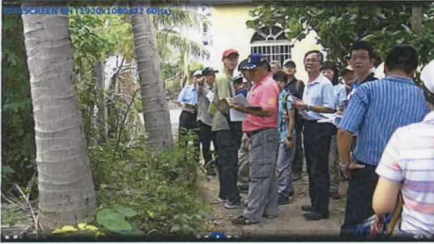
龍泉水段 803 地號