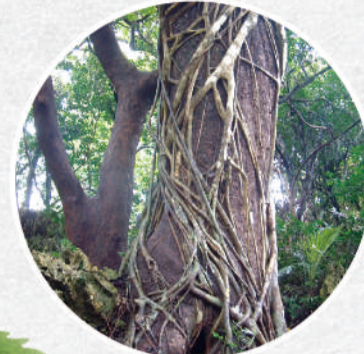
榕屬植物的纏勒現象

遊樂區位於恆春半島南端，屬熱帶型氣候區，年平均溫度約25.8℃，溫度最低的1月份均溫仍超過20℃，可謂四季如春。年均降水量約1957 mm，夏季降水量較高，每年10月到隔年4月之間，東北季風翻越中央山脈形成乾燥的落山風，風速強勁，為本區氣候一大特色。