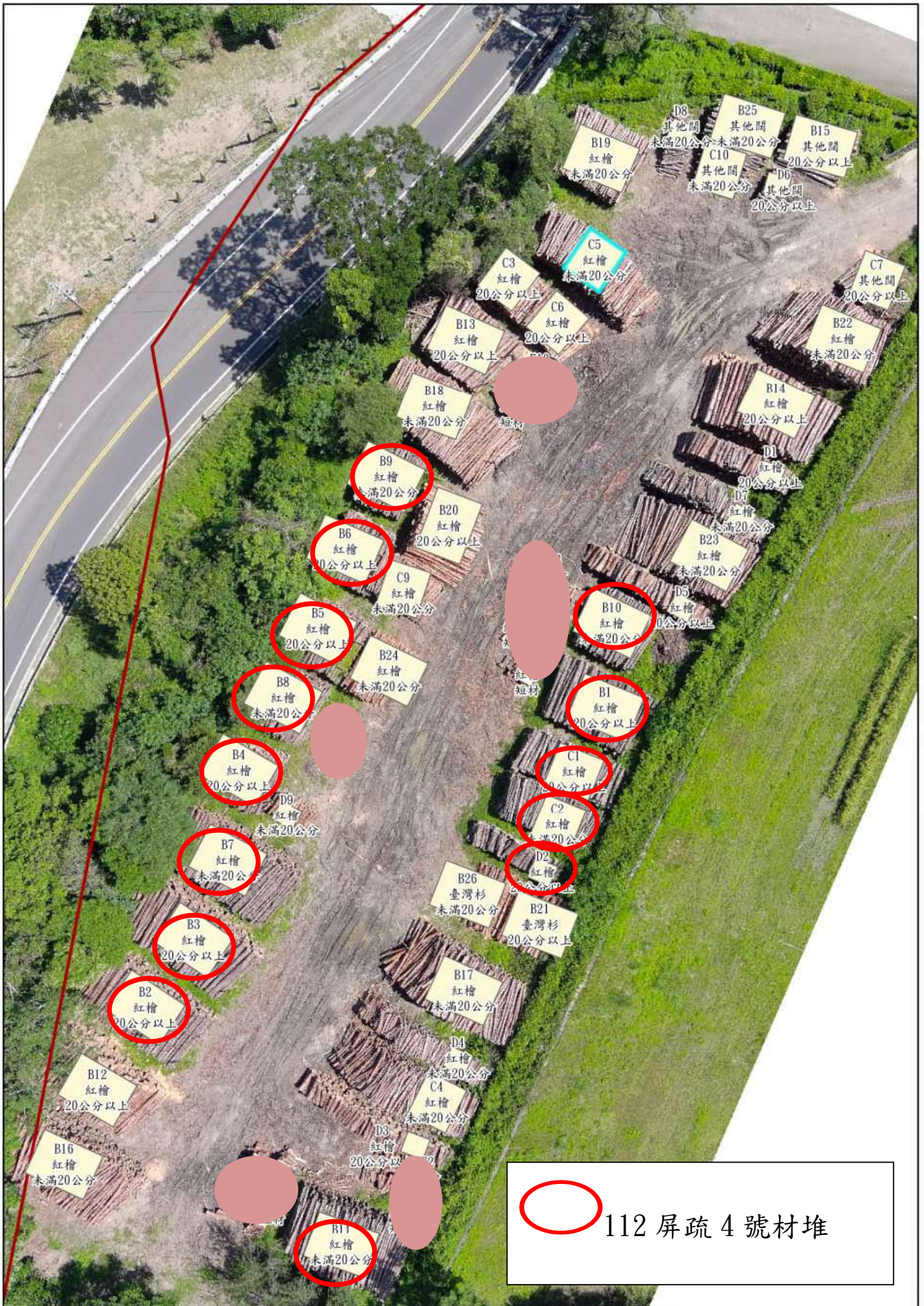
112 屏疏 4 號材堆