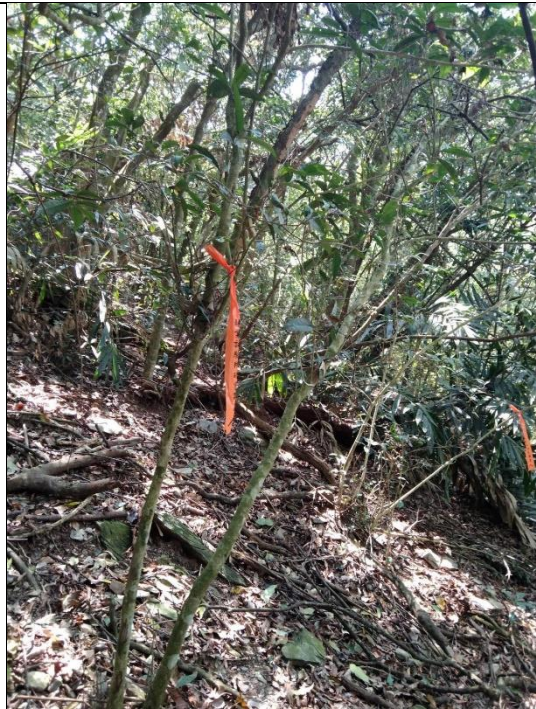
十八羅漢山—臺灣山茶母樹(編號 2106)