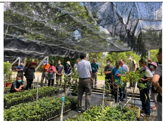
圖 10、學員討論及意見交流。