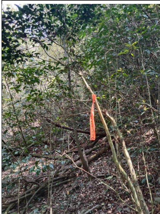
太原山—臺灣山茶母樹(編號 8768)