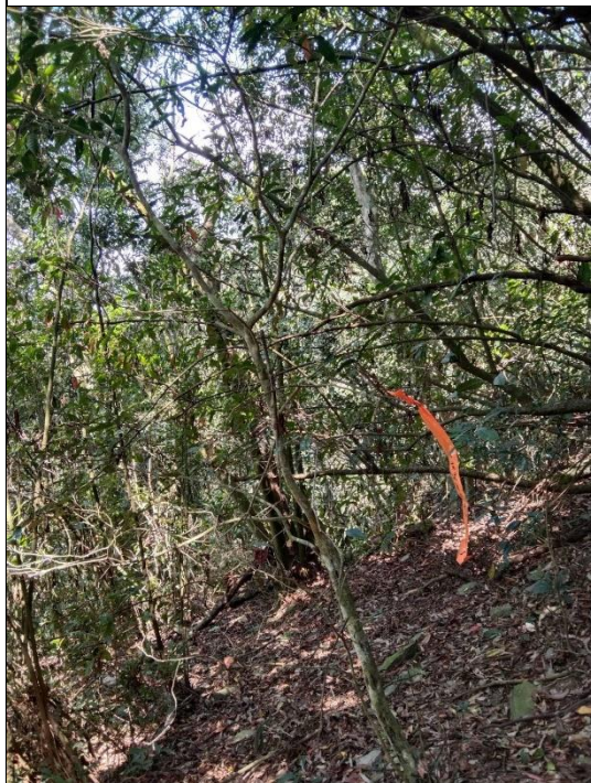
真笠山—臺灣山茶母樹(編號 2110)