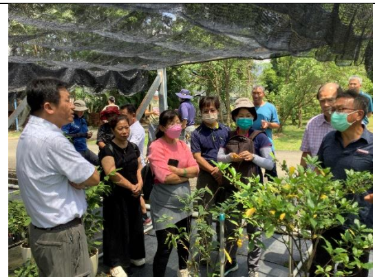
圖 8、山茶苗圃參訪與討論。