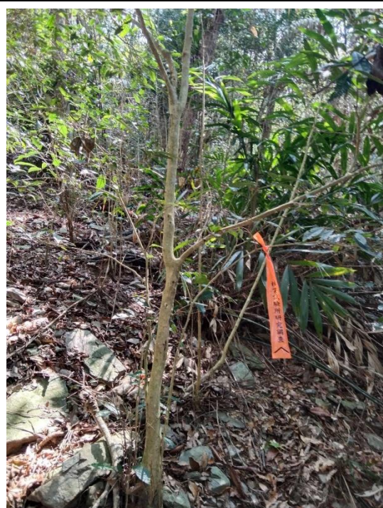
十八羅漢山—臺灣山茶母樹(編號 2102)