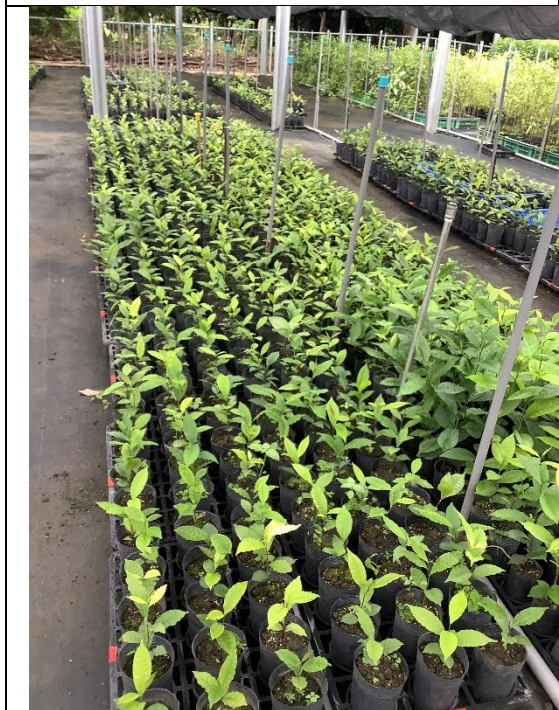
2023年8月4日種子苗生長情形。