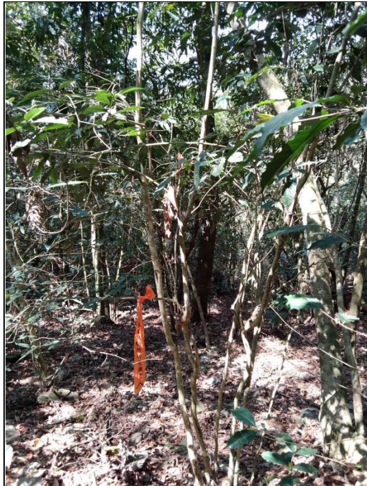
十八羅漢山—臺灣山茶母樹(編號 2105)