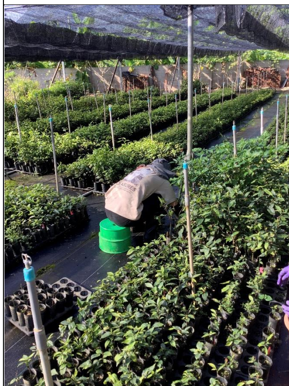
圖 4、期末繳交種子苗整理情形。