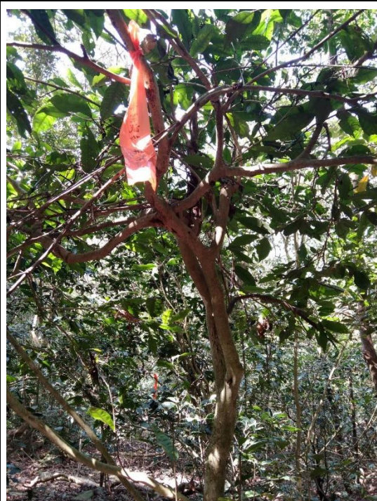
太原山—臺灣山茶母樹(編號 8770)