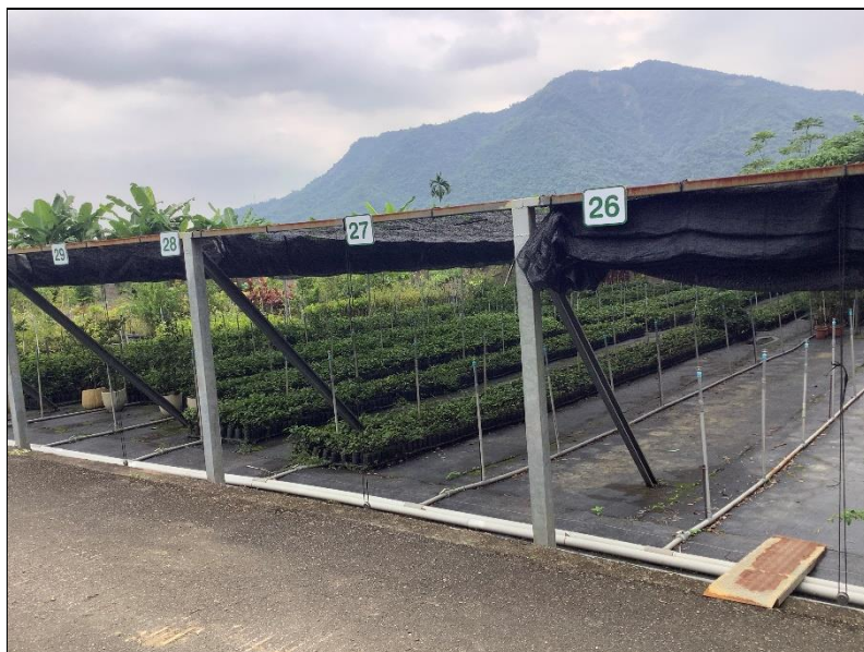
圖 3、本計畫期末提供之 7,000 株臺灣山茶種子苗。

本計畫挑選臺灣山茶種子苗 7,000 株(圖 3、4)，平均苗高 19.8 cm，作為期末成果繳交用。