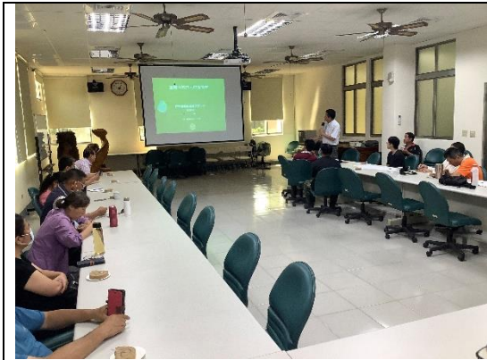
圖 5 蔡主任講課情形。