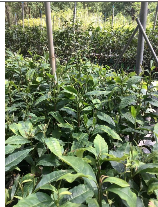
2023年9月21日種子苗生長情形。