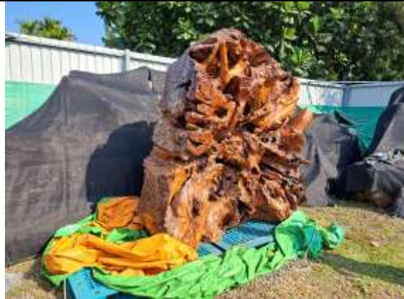
113 屏賊 3 號