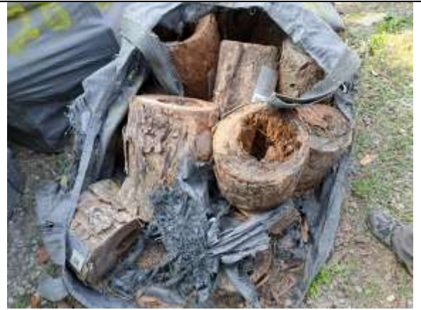
113 屏賊 2 號