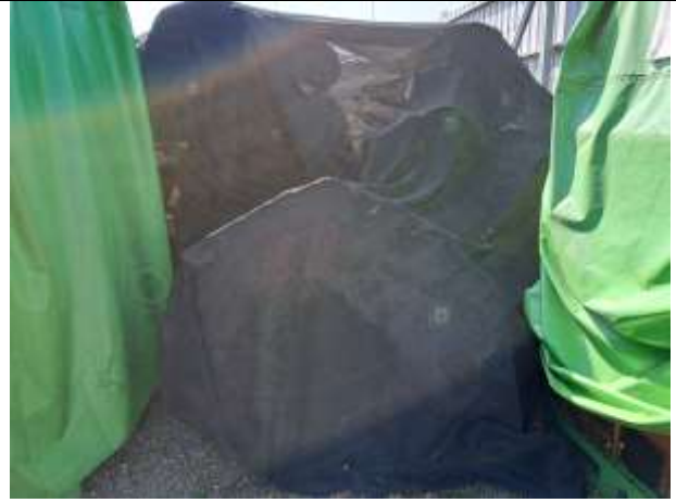
113 屏賊 4 號