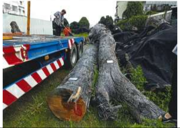
113 屏賊漂 1 號