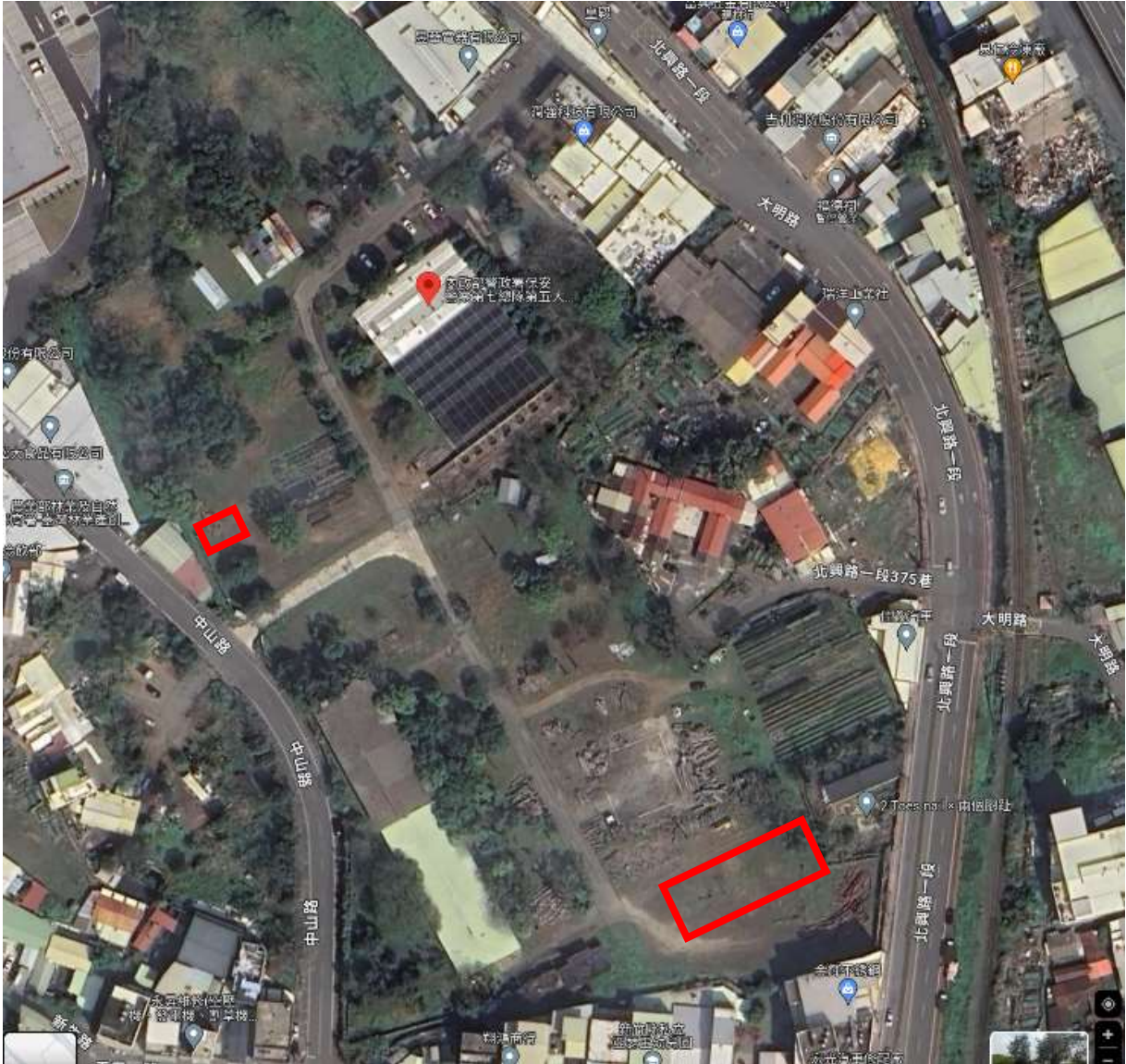
地點：新竹分署竹東貯木場