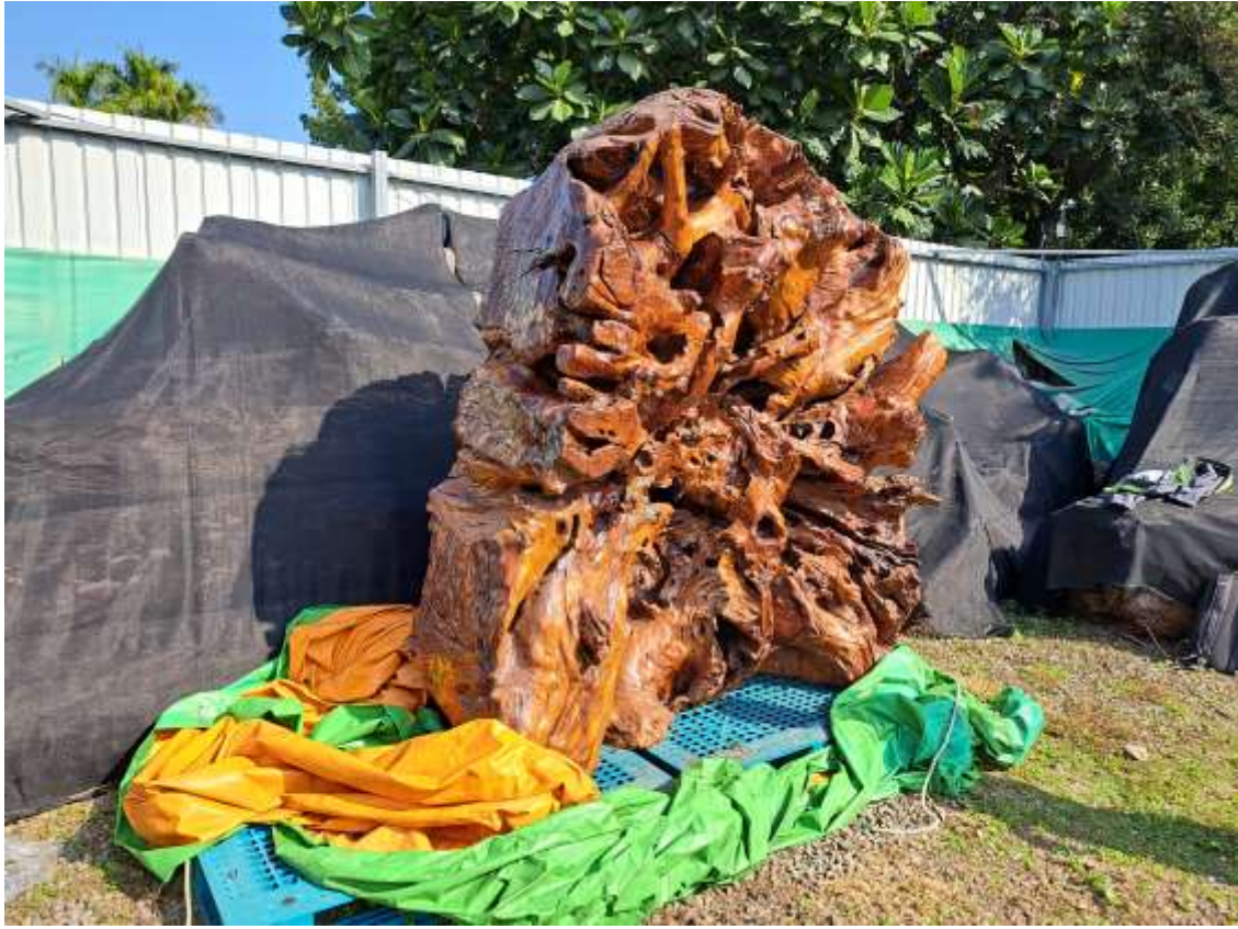
113 屏臧 3 號