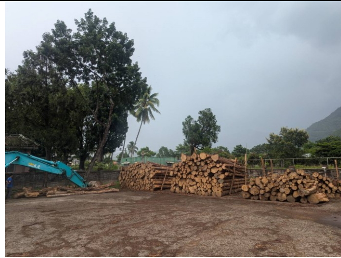
113 屏疏 2 號