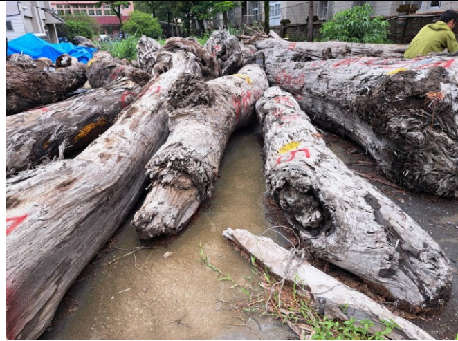
113 屏漂 2 號