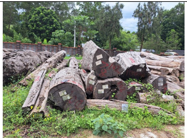
113 屏賊 7 號