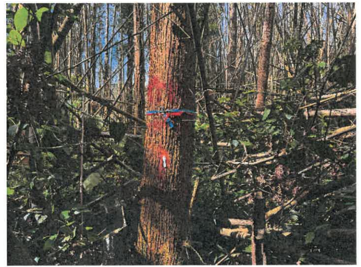
編號 10 樹種 杉木