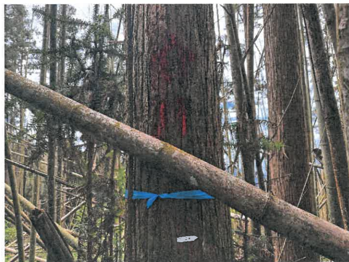
編號 11 樹種 杉木