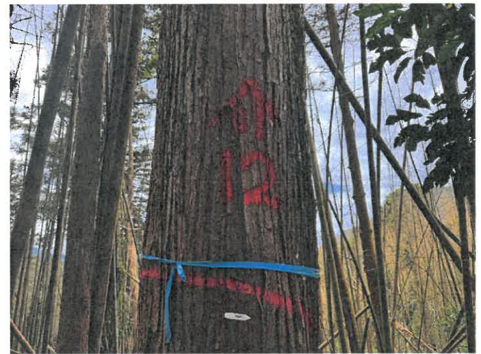
編號 12 樹種 杉木