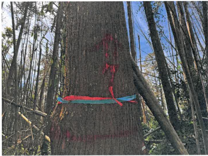
編號 7 樹種 杉木