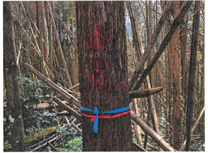
編號 8 樹種 杉木