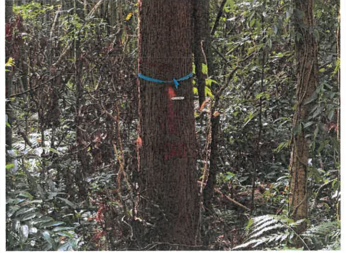
編號 19 樹種 杉木