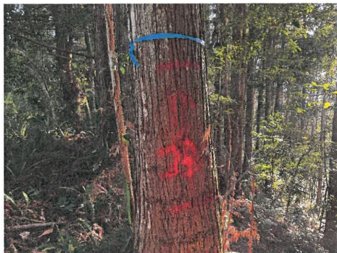
編號 23 樹種 杉木