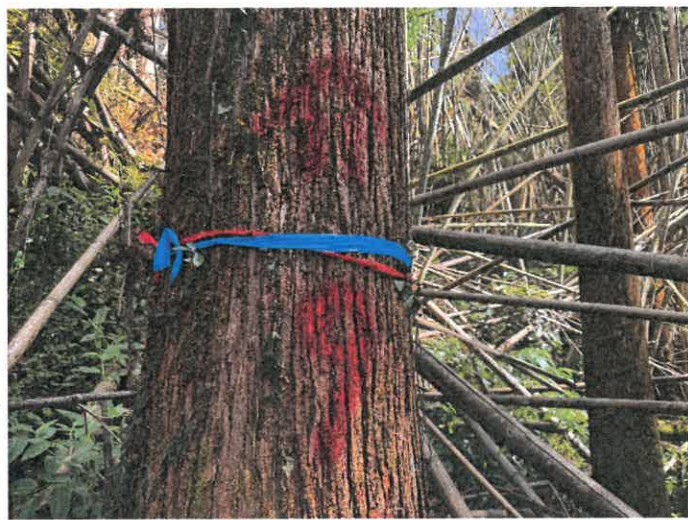
編號 9 樹種 杉木