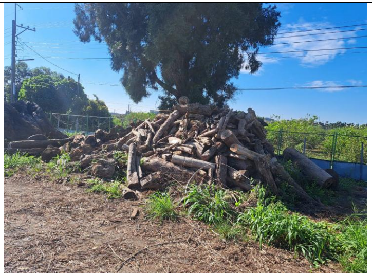
114 屏贓 5 號