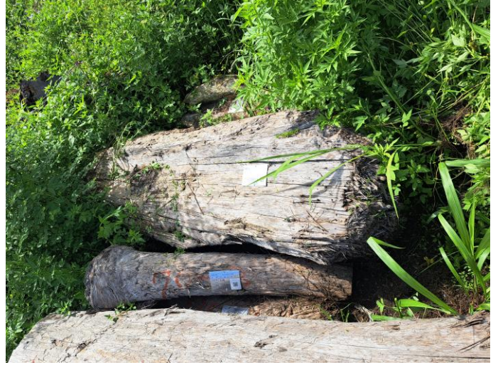
114 屏贓 3 號