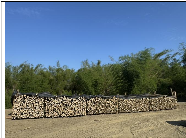
115 屏竹 3 號荊竹現況