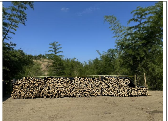
115 屏竹 4 號荊竹現況